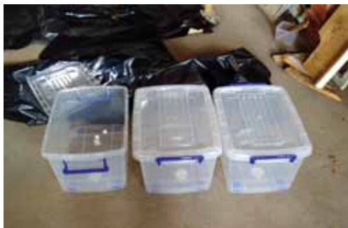
Figura 5 – Experiência com para-dichlorobenzeno em recipiente de 30 l.

com o fumigante sólido Vapona, em que se usou uma tira. Foram realizadas três réplicas para cada um dos tratamentos.