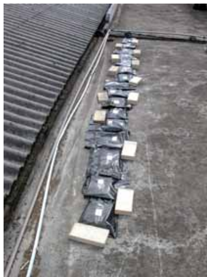
Figura 3 – Sacos de plástico expostos à luz solar e fixos com blocos para evitar o impacto do vento.