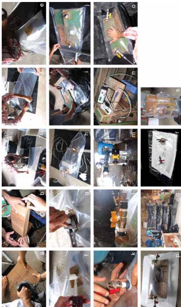
Figura 6 – Sequência de montagem de uma bolha de gás: a) cortando a madeira infestada; b) colocando fita-cola nas extremidades; c) e d) selando e cortando as extremidades do plástico; e) reforço com fita-cola; f) aplicando silicone; g) assegurando que o passa-palmeis está bem colocado; h) bolha pronta a ser usada; i) colocando as peças de madeira dentro da bolha; j) selando a bolha com a pinça; k) e l) adaptação das válvulas nos passa-palmeis; m) medidor de humidade e pressão; n) registador de gases; o) enchendo a bolha com gás; p) bolha com dióxido de carbono; q) bolhas dispostas numa prateleira; r) bolhas sem gás; s) bolha com uma cadeira e uma gaveta.