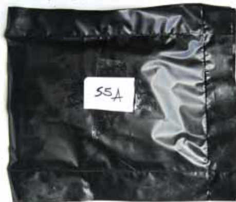
Figura 2 – Sacos de plástico selados.