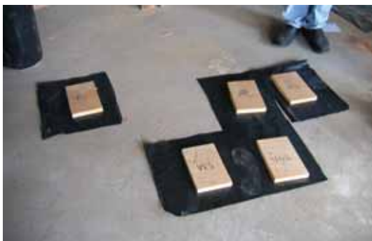
Figura 1 – Montagem dos sacos de plástico.

Foram realizadas quatro réplicas para cada um de quatro tempos diferentes de exposição (1, 2, 3 e 4 semanas), num total de 16 sacos de plástico com madeira infestada. Dezasseis outros sacos de plástico, igualmente com madeira infestada, serviram de controlo e foram montados de igual modo e colocados dentro do laboratório num local à sombra e afastado das janelas.