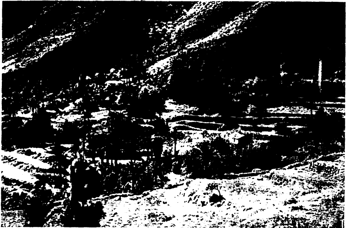
Abb. 3: La Gomera: Umgebung des Dorfes Benchijigua.