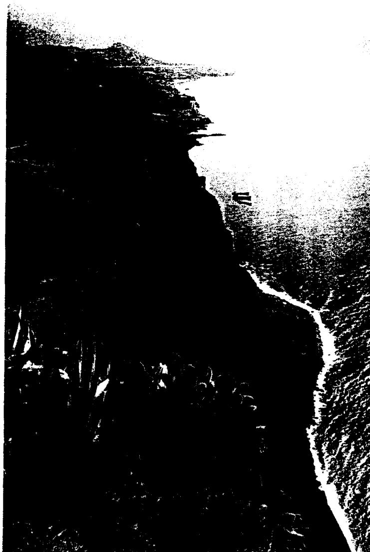
Abb. 4: Madeira: Vom Cabo Girão, westlich Funchal, fällt der Blick 580 m tief hinab zum Meer.

Zargus crotchianus WOLL., 1865: endemisch auf G, G: Straße nach Benchijigua N Santiago, 600-750 m, 9.2.89 (2 Expl.)