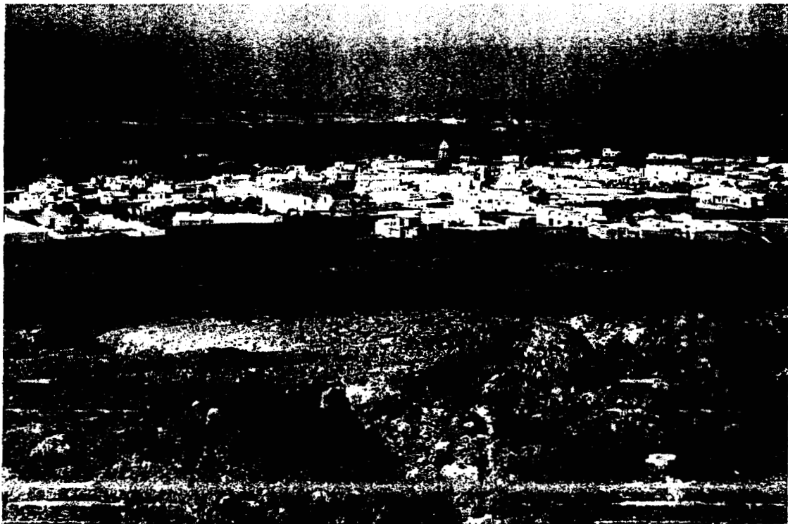
Abb. 1: Tabayesco liegt im nördlichen Teil der Insel Lanzarote.

Das Belegmaterial befindet sich in coll. E. & U. AISTLEITNER, Feldkirch, J. L. LENCINA GUTIERREZ, Jumilla/Spanien sowie in der Zoologischen Staatssammlung, München.