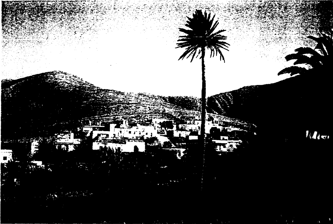
Abb. 2: Toto (Fuerteventura). Da die Passatwinde aufgrund der geringen Meereshöhe über die östlichen Kanaren streichen, ohne ihre Feuchtigkeit im wesentlichen abzuregen, hat sich keine Waldvegetation entwickelt.