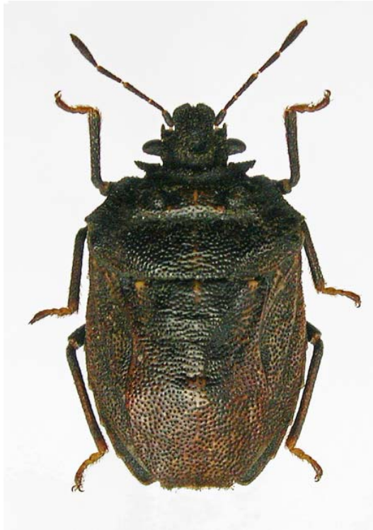
Fig. 1.—Habitus de Scotinophara sicula (A. Costa, 1841). Fig. 1.—Habitus of Scotinophara sicula (A. Costa, 1841).