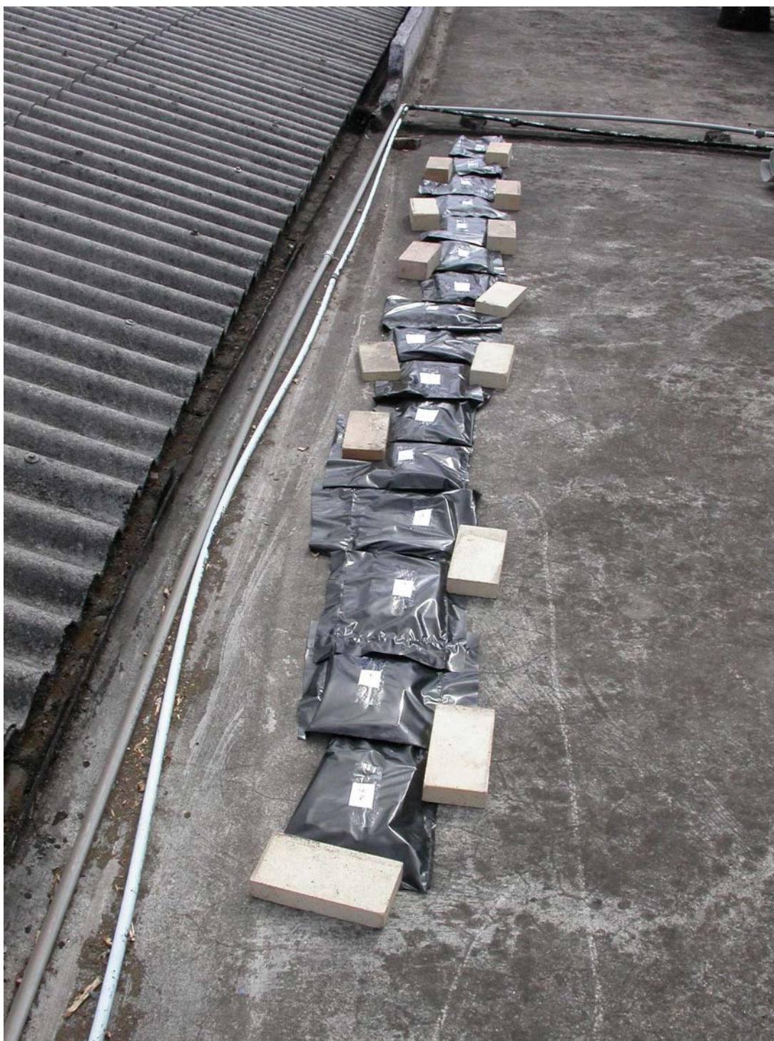
Figura 3. Sacos de plástico expostos à luz solar e fixos com blocos para evitar o impacto do vento.