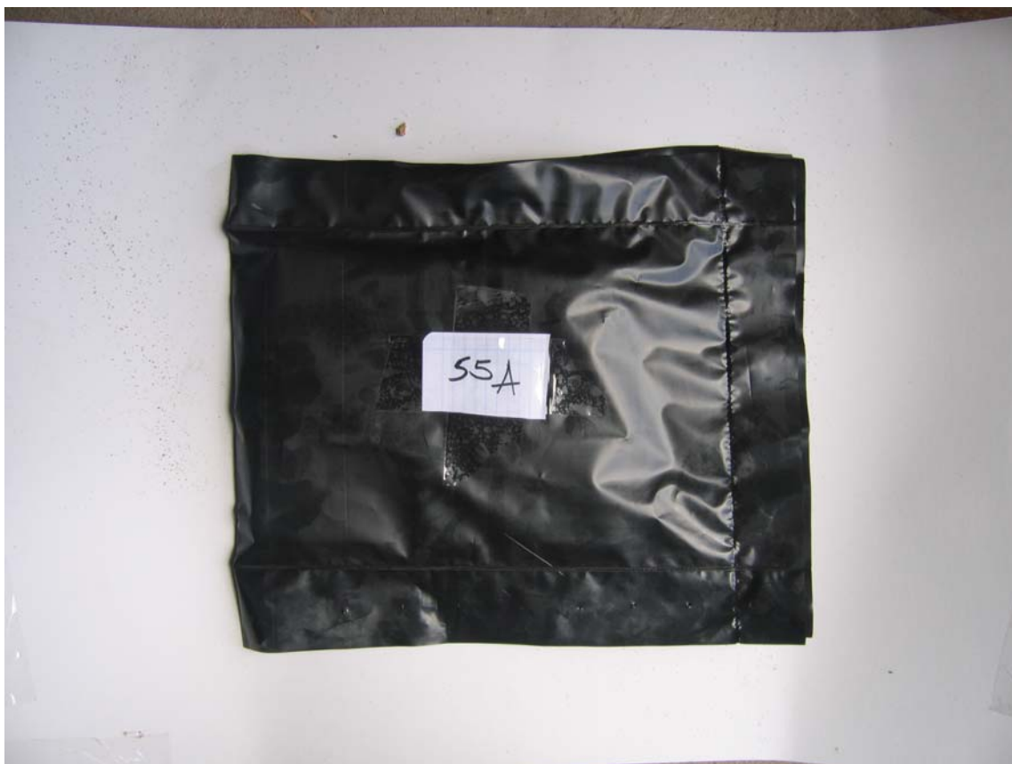
Figura 2. Sacos de plástico selados.