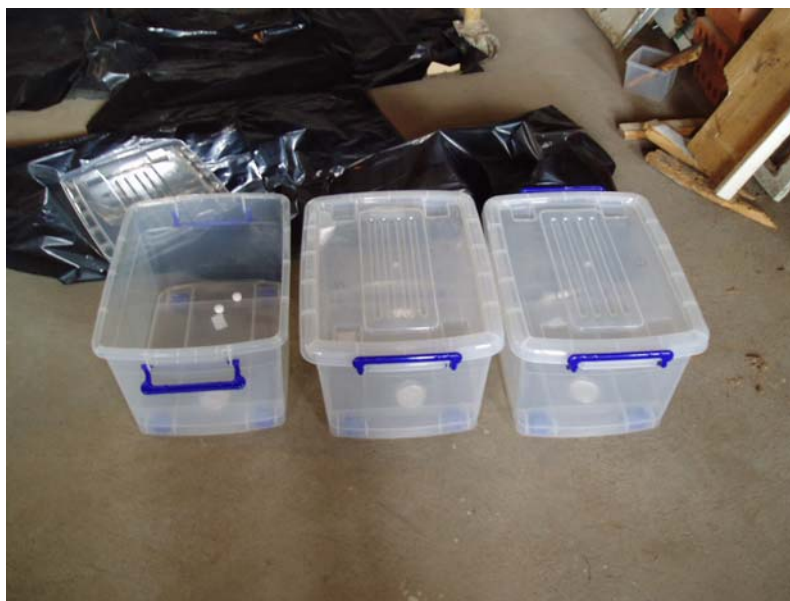
Figura 5. Experiência com para-dichlorobenzeno em recipiente de 30 litros.

Os materiais usadas nesta experiência foram 12 caixas de plástico, 12 caixas de Petri, papel de filtro e térmitas. Foi colocada uma bola de naftalina numa caixa de plástico (Figura 5), juntamente com a caixa de Petri, o papel de filtro e 10 térmitas. O mesmo foi feito para o para-dichlorobenzeno, mas, neste caso, foram usadas duas bolas em cada caixa e o mesmo sucedeu com o fumigante sólido Vapona, em que se usou uma tira. Foram realizadas três réplicas para cada um dos tratamentos.