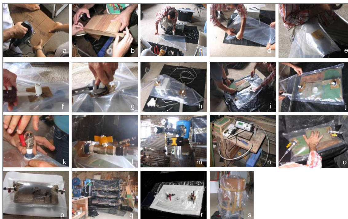
Figura 6. Sequência de montagem de uma Bolha de Gás: a) cortando a madeira infestada; b) colocando fita-cola nas extremidades; c) e d) selando e cortando as extremidades do plástico; e) reforço com fita-cola; f) aplicando silicone; g) assegurando que o passa-painés está bem colocado; h) bolha pronta a ser usada; i) colocando as peças de madeira dentro da bolha; j) selando a bolha com a pinça; k) e l) adaptação das válvulas nos passa-painés; m) medidor de humidade e pressão; n) registador de gases; o) enchendo a bolha com gás; p) bolha com dióxido de carbono; q) bolhas dispostas numa prateleira; r) bolhas sem gás; s) bolha com uma cadeira e uma gaveta.

Começámos por cortar peças de madeira infestada (Figura 6a), identificando-as com a letra “A” para tratamento e “B” para o controlo. As extremidades das peças foram cobertas com fita-cola para evitar a entrada fácil do gás (Figura 6b). Depois de cortar o plástico com o tamanho das peças a tratar, selou-se os lados, usando uma pinça de selar eléctrica e deixando, apenas, uma abertura de um lado (Figuras 6c e 6d). O plástico usado é chamado de poliskin . É feito a partir de outros tipos de plástico e é específico para receber este tipo de gases.