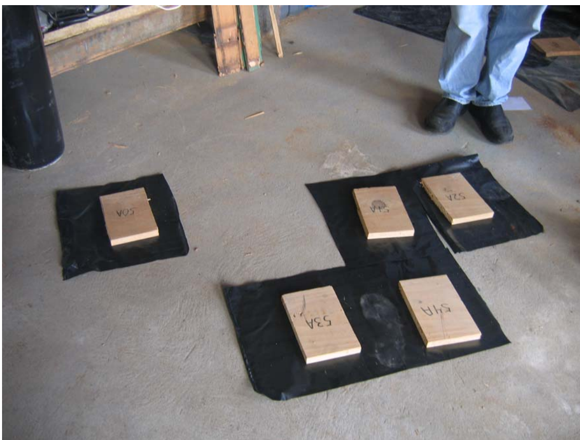
Figura 1. Montagem dos sacos de plástico.

Foram realizadas quatro réplicas para cada um de quatro tempos diferentes de exposição (1, 2, 3 e 4 semanas), num total de 16 sacos de plástico com madeira infestada. Dezasseis outros sacos de plástico, igualmente com madeira infestada, serviram de controlo e foram montados de igual modo e colocados dentro do laboratório num local à sombra e afastado das janelas.