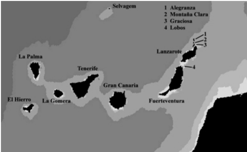
FIG. 2.—Archipiélago de las Canarias e islote de Selvagem Grande. [Map of the Canary Archipelago and the islet of Selvagem Grande.]