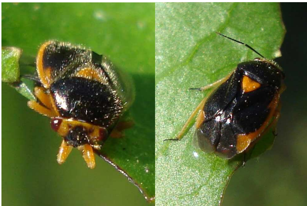
Fig. 1: Puig de Montilivi, 23-V-2011, (BARBARÀ, 2011). http://www.biodiversidadvirtual.org/insectarium/Strongylocoris-erythroleptus-img218536.html http://www.naturamediterraneo.com/forum/topic.asp?TOPIC_ID=157339

No hay planta hospedadora para este encuentro pues el ejemplar estaba ahogándose en una piscina de la que fue rescatado. El Puig de Montilivi es una colina de 167,9 m de altitud máxima, principalmente de suelo calcáreo, con coscoja ( Quercus coccifera ). Está cruzada por varias líneas eléctricas que se mantienen limpias de vegetación. También hay algunas encinas, alcornoques y restos de antiguos cultivos de almendros y olivos en terrazas hechas con muros de piedra. Estas fotos fueron cargadas por el autor de las mismas en la web BiodiversidadVirtual.org el 23-X-2011, (BARBARÀ, 2011), y luego como parte del proceso de determinación, cargadas en la web Naturamediterraneo.com por L. Vivas (2011), donde la especie fue finalmente reconocida e identificada por P. Dioli (2011).