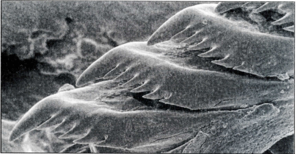
Figura 3.- Facelinopsis marioni (Vayssiere, 1888). Detalle del diente radular.