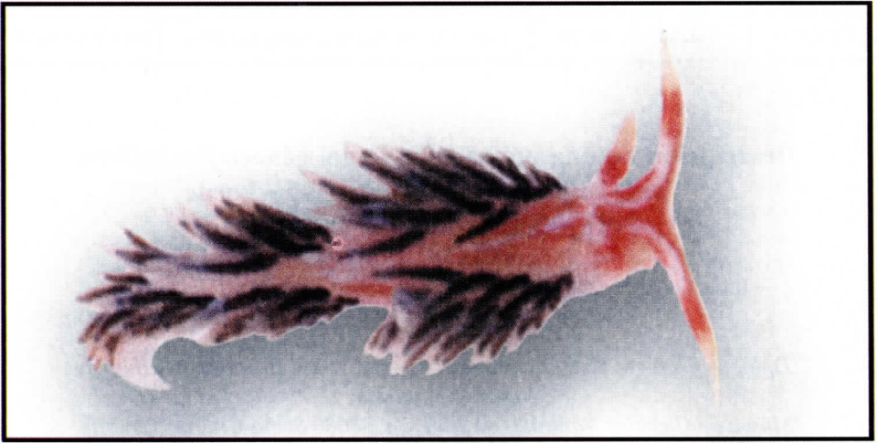
Foto 1.- Pruvotfolia rochebruni , especie nueva. Bahía de Faja (localidad tipo), isla de Brava, Cabo Verde.