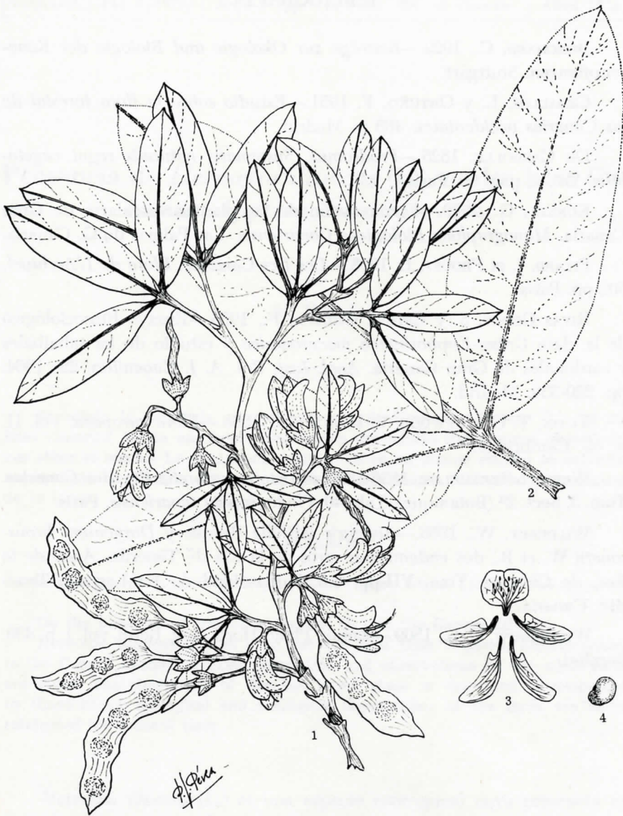
Lám.: I.— Anagyris latifolia Brouss. 1: rama florífera y fructífera. 2: hoja muy desarrollada de un brote joven. 3: morfología de la corola. 4: semilla. (X 3/5).